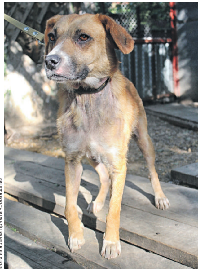
■ Фотография Софы Серпик

Некоторые работы Софы – рваные, мятые, забрыз-