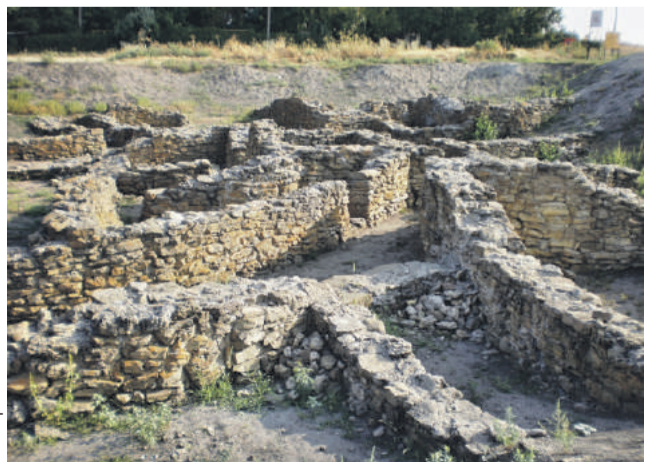
■ Танаис. Улучки в нем тесны и извилисты, чтобы врагам трудно было воевать при захвате города