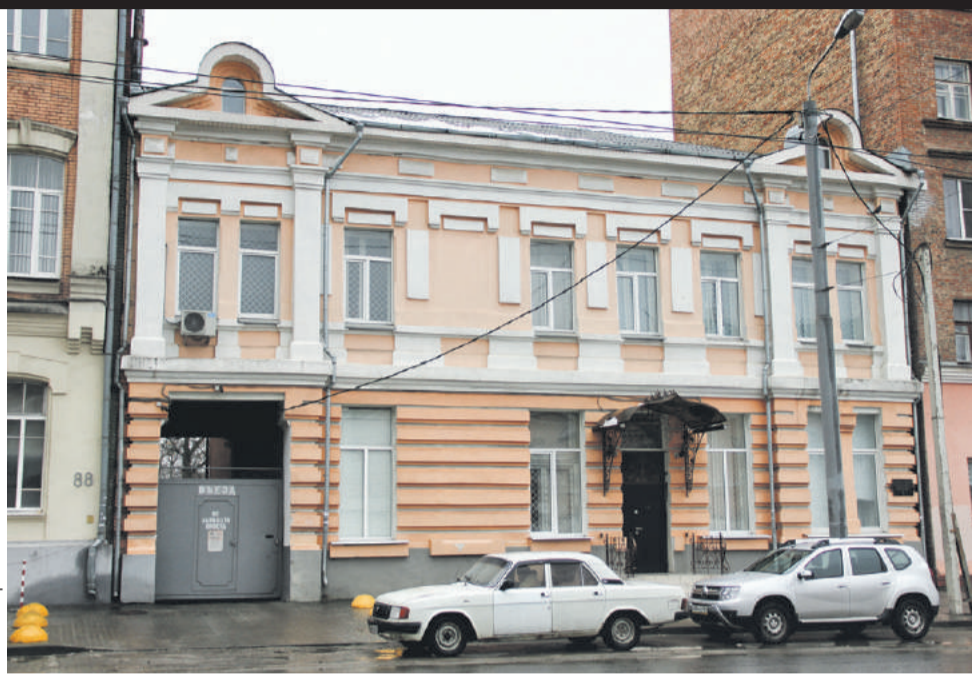
■ Здание бывшей католической школы

В декабре 1915 года в Ростов-на-Дону перебрался Русский императорский Варшавский университет. Сначала летом 1915 года Варшавский университет вывезли в Москву, где он некоторое время – пока варшавяне думали, что де-