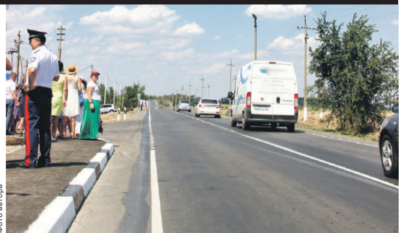
■ Автомобильная дорога общего пользования от хутора Задонского и поселка Каяльского к федеральной автостраде

В общей сложности строительные организации Дона за пять лет выполнили объем работ на 760 млрд рублей. Из них за прошлый год – более чем на 161 млрд», – говорится в поздравлении.