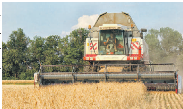
■ Взятый микрозайм помог Алексею Щепетьеву приобрести упаковочное оборудование для муки