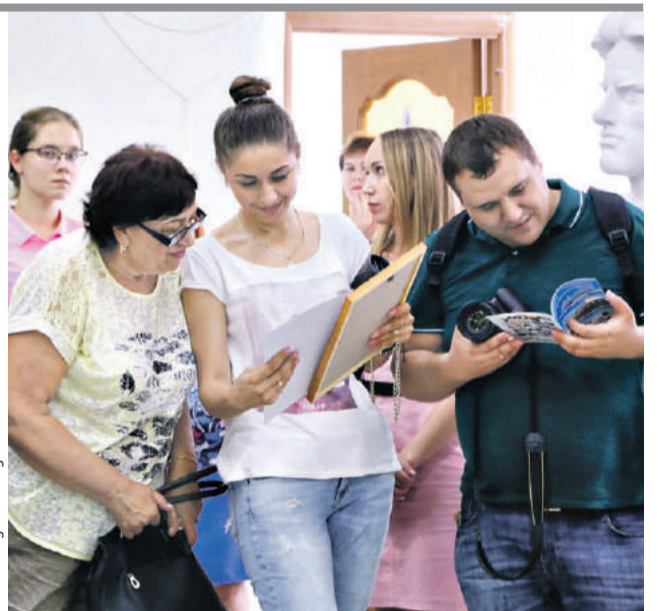
На открытии выставки «Мой мир»

В экспозиции представлены работы художников из России, Украины, Беларуси, Казахстана, Узбекистана, Латвии, Эстонии,