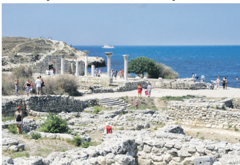
■ Херсонес. В отличие от Танаиса улицы здесь прямые и просторные

В наше время Анапа выглядит настолько современным курортом, что туристы порой и не подозревают, что под ее нынешними постройками находится древнегреческий город Горгиппия, один из самых богатых городов Боспорского царства. Возведен он был во второй половине VI века до н.э. и успешно процветал около десяти веков, войдя