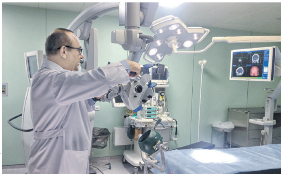
■ «Акафарм» снабжает лекарствами больницы и поликлиники по всему югу страны

вать компанию вместе. А еще буквально через день они смогли купить готовое агентство – «ПРОгуляй».