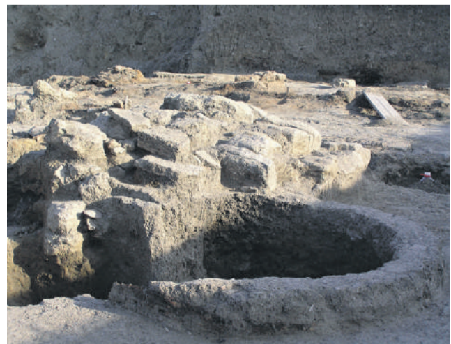
■ Фанагория — остатки дворца

Когда, наконец, заработает данный маршрут, не сообщается, но, думается, туристы, отправившиеся по нему, не пожалуют, поскольку помимо памятников их будут ждать два теплых моря — Азовское и Черное.