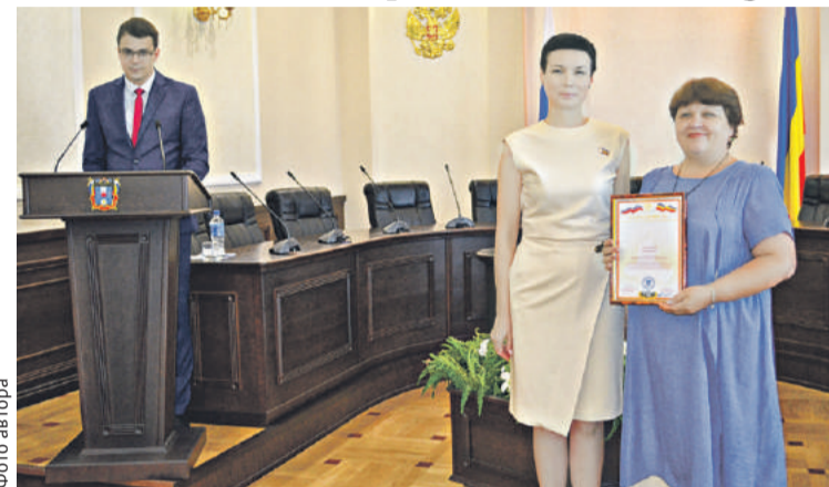
■ В донском парламенте поощрили тех, кто внес наиболее заметный вклад в работу комитета по законодательству

Особенно популярным на Дону стал проект «Дни правового просвещения в Ростовской области». В его рамках проходили открытые лекции, круглые столы, семинары ведущих специалистов в различных областях права, открытые уроки, бесплатные юридические консультации. В этом начинании поучаствовали специалисты более 70 госорганов, общественных и коммерческих организаций. А помочь удалось более чем 7500 дончанам. В