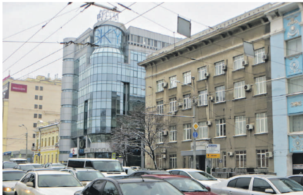
■ Угол Ворошиловского и Шаумяна – место клуба «Огниво»

Одним словом, польский след весьма заметен на донской земле – в том числе и в театре: например, в Ростовском академическом молодежном идет пьеса Леонида Зорина «Варшавская мелодия». Театральные студии города (в 1960-х – 1970-х будучи значительно радикальнее, чем театры государственные) изучали эксперименты режиссера Ежи Гротовского. В торжественном полонезе (польский танец) выходят гости бала в «Евгении Онегине» Чайковского, опере, претерпевшей уже три редакции на сцене Ростовского музыкального театра, но не покидающей его репертуар.